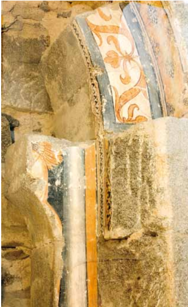
Mosteiro de Santa Maria de Pombeiro. Parede sul da nave. Motivos decorativos.