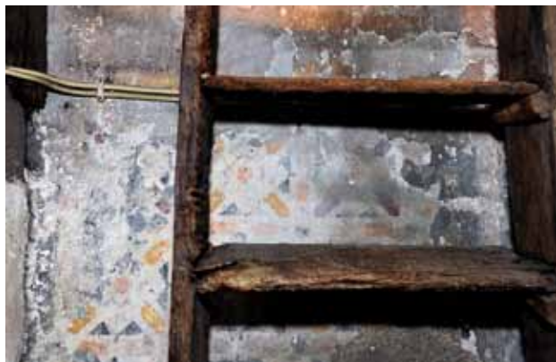
Igreja de Santa Maria de Meinedo. Rodapé da parede fundeira da capela-mor do lado da Epístola (atrás do retábulo-mor). Pintura decorativa.

se, muito provavelmente, em motivos da azulejaria de corda seca do século XVI.