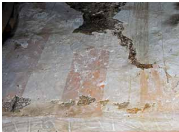
Igreja de São Tiago de Valadares. Topo da parede fundeira da capela-mor (atrás do retábulo-mor). Barras verticais em vermelho e branco.

das paredes fundeira e laterais da capela-mor veem-se barras verticais em vermelho e branco, alternadamente, tendo-se aplicado, pelo menos nas vermelhas, pequeno motivo de sugestão floral. Na parede fundeira sucede-se,