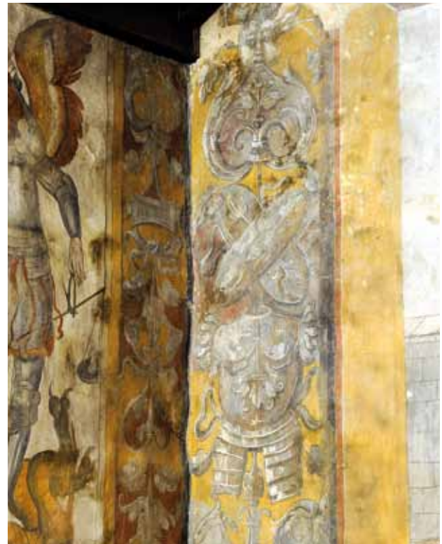
Igreja de Santo Isidoro de Canaveses. Capela-mor. Molduras retilíneas e barras verticais com motivos de rinceaux e de pendurados de armaria.

Nos enquadramentos destas figurações usam-se molduras retilíneas e barras verticais que, alternadamente, têm motivos de rinceaux (folhagens enroladas) ou de