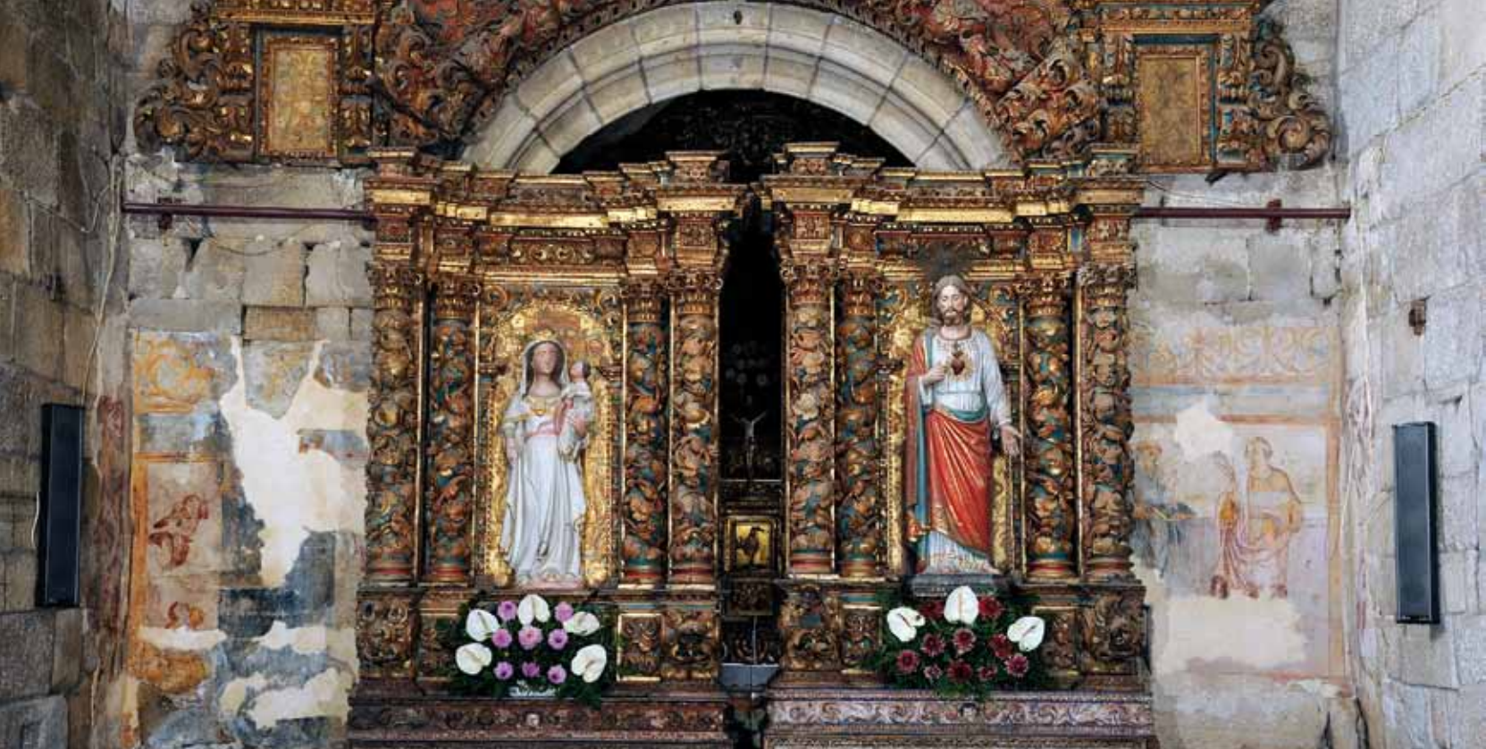
Mosteiro de Santa Maria de Cárquere. Paredes do arco triunfal e da nave (atrás dos altares colaterais).