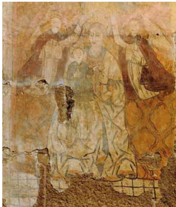
Igreja de São João Baptista de Gatão. Parede do arco triunfal do lado do Evangelho. Nossa Senhora com o Menino coroada por anjos .

Do lado do Evangelho (do lado esquerdo do arco triunfal) figurou-se Nossa Senhora com o Menino coroada por anjos e, do lado da Epístola (do lado direito do arco