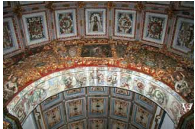
Igreja de São Martinho de Soalhães. Intradorso do arco triunfal. Folhas de acanto enroladas.

Nesta Igreja há ainda pintura mural na abóbada da capela adossada à nave do lado norte (do lado esquerdo da Igreja), sendo visíveis dois programas de pintura mural sobrepostos. O primeiro é uma composição com folhas de acanto enroladas e pássaros, dois motivos característicos da talha de “estilo nacional”. Por cima deste programa foi pintado um outro que exhibe, ao centro, uma coroa de flores. É difícil datar este último programa, por não possuir características exemplares de nenhuma linguagem artística específica; mas colocamos as hipóteses de poder datar dos finais do século XVIII ou já dos inícios do século XIX.