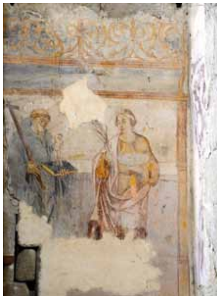
Mosteiro de Santa Maria de Cárquere. Parede do arco triunfal do lado da Epístola (atrás do altar colateral). Santo António e Santa Luzia.

Estas duas pinturas foram realizadas pela mesma oficina, como é testemunhado pela forma comum de tratar quer as figuras (já manifestando a influência de um gosto maneirista (c. 1540-1680)), quer o topo das pinturas, que faz lembrar o trabalho de talha no topo do sofisticado e bellissimo cadeiral manuelino da Igreja de Santa Cruz de Coimbra.