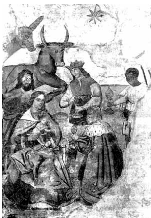
Mosteiro do Salvador de Freixo de Baixo. Parede norte da nave. Epifania ou Adoração dos Reis Magos (DIREÇÃO-GERAL DOS EDIFÍCIOS E MONUMENTOS NACIONAIS – Conservação de frescos. Monumentos: Boletim da Direção-Geral dos Edifícios e Monumentos Nacionais . [CD-ROM]. Lisboa: MOP-DGEMN. N.º 106 (Dez. 1961), fig. 13).

O que atualmente se pode ver é um fragmento de pintura destacada, apresentada ao modo de um quadro.