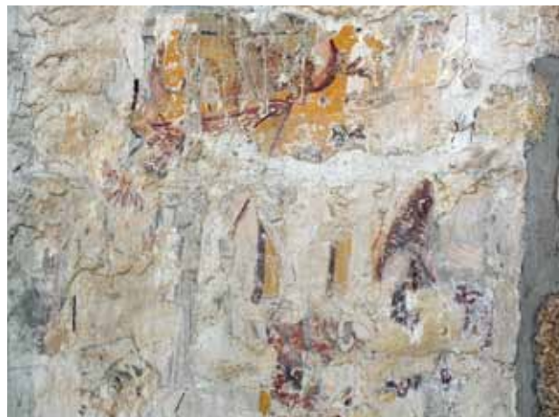
Igreja de São Nicolau de Canaveses. Parede do arco triunfal do lado do Evangelho. Anunciação de São Gabriel à Virgem Maria .

Na parede do arco triunfal sobre o altar de fora do lado do Evangelho (altar colateral esquerdo), que aí certamente existiria, conservam-se várias pinturas sobrepostas, mas é possível identificar que numa delas se figurava uma Anunciação de São Gabriel à Virgem Maria realizada pela oficina que fez as pinturas de São Salvador de Bra-