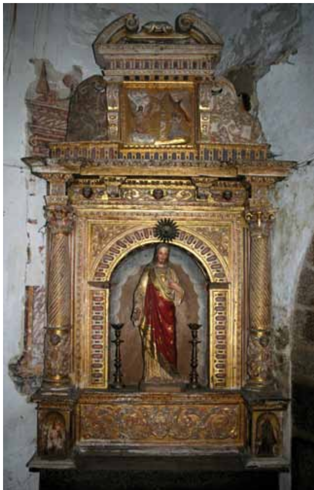
Igreja do Salvador de Lufrei. Parede norte da nave. Retábulo fingido.

Na parede norte da nave (do lado esquerdo da Igreja) é visível parte de uma pintura que finge um retábulo com colunas de marmoreados e de provável gosto maneirista (c. 1540-1680). Parece que primeiro se pintou aqui um