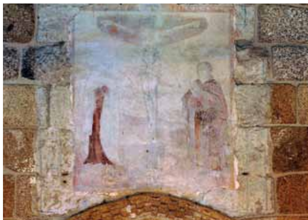
Igreja de São João Baptista de Gatão. Topo do arco triunfal. Calvário com Nossa Senhora e São João .

Nesta Igreja há ainda um programa de pintura mural mais tardio do que os já referidos quer na capela-mor, quer no arco triunfal. Trata-se do Calvário com Nossa Senhora e São João , que se coloca no topo do arco triunfal;