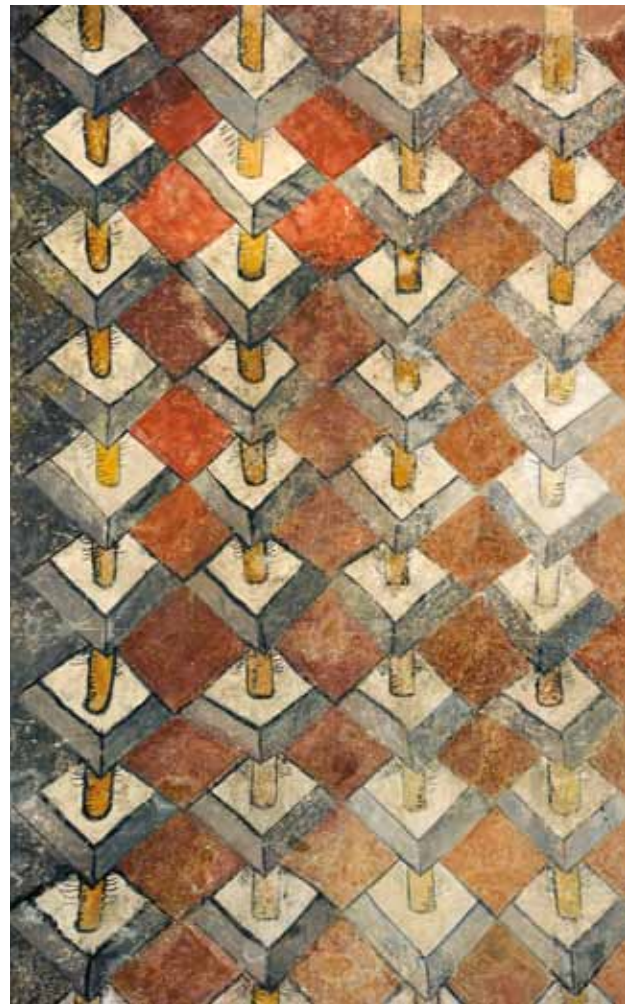
Igreja do Salvador de Tabuado. Parede fundeira da capela-mor. Grinalda de losangos .

recursos construtivos característicos da arquitetura manuelina). Este espaço central, assim definido, é acompanhado, de ambos os lados, por padrão decorativo de caráter geométrico (uma espécie de grinalda de losangos , motivo que não ocorre em mais nenhum caso de pintura mural conhecida até agora). No topo da área com pintu-