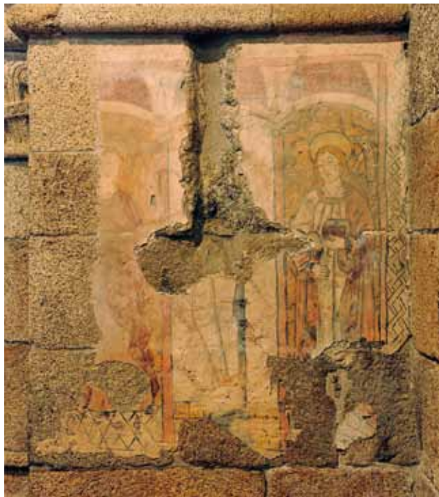
Igreja de São João Baptista de Gatão. Parede do arco triunfal do lado da Epístola. Santa Luzia , São Sebastião e Santa Catarina de Alexandria .

triumfal), três santos: Santa Luzia , São Sebastião e Santa Catarina de Alexandria . Estas pinturas devem espelhar as mais fortes devoções dos paroquianos da época.