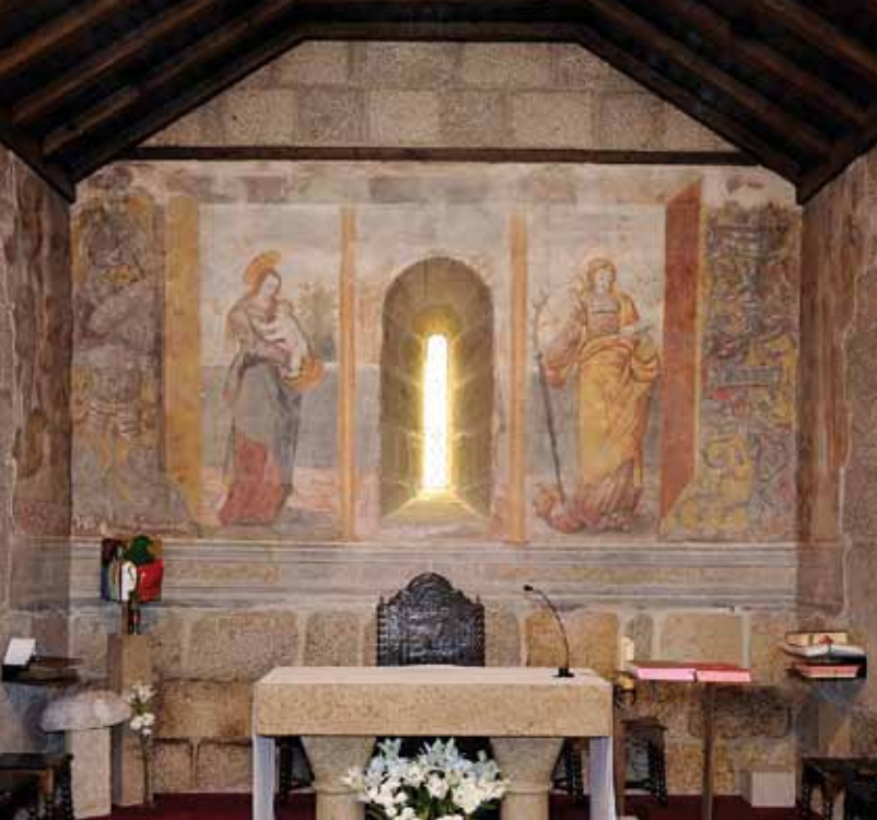
Igreja de Santo Isidoro de Canaveses. Parede fundeira da capela-mor. Santo Isidoro ladeado por Nossa Senhora com o Menino e por Santa Catarina de Alexandria .