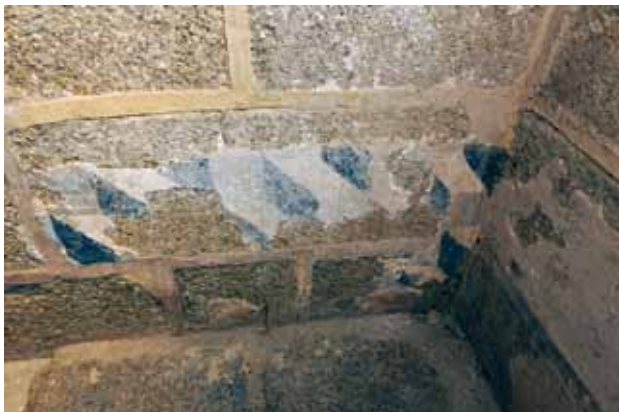
Igreja de Santo André de Telões. Parede fundeira da capela-mor (atrás do retábulo-mor). Paralelepípedos perspectivados .