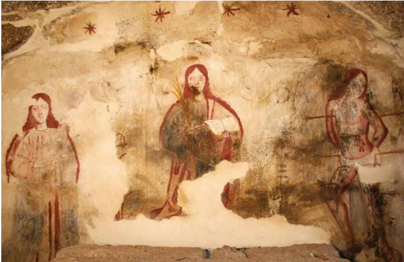
Capela de Santa Comba de Telões. Parede fundeira da capela-mor. Santa Comba , ladeada por Nossa Senhora com o Menino e São Sebastião .

De facto, nas Visitações à Igreja de Santo André de Telões, no concelho de Amarante (ver p. 27), que pertencia ao padroado da Igreja Colegiada de Nossa Senhora da Oliveira de Guimarães, repetidamente os visitantes dos arcebispos de Braga se referem a capelas anexas a esta igreja paroquial, ordenando, para aquelas, obras e aquisições 5 , sem nunca, no entanto, referirem os seus no-