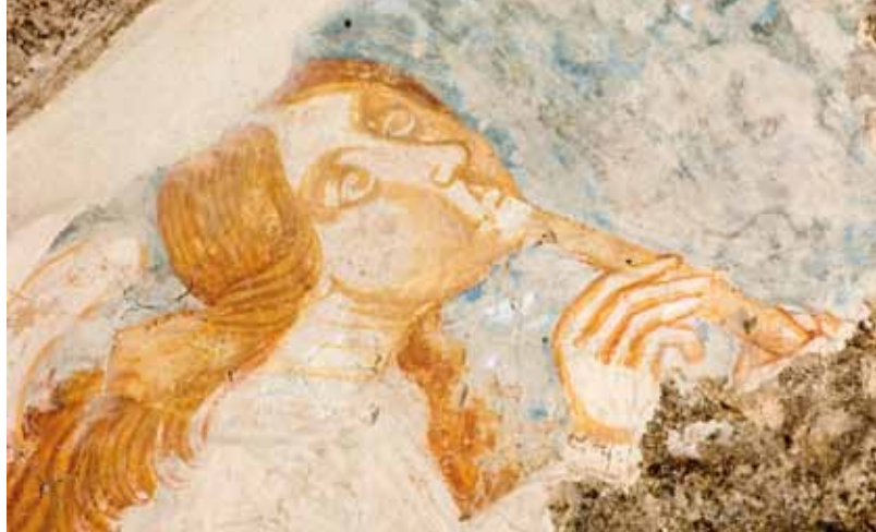
Ermida da Nossa Senhora do Vale. Anjo a tocar flauta.

Muito mais tarde foi realizado, no intradorso do arco, um programa de pintura decorativa com folhas de acanto enroladas, motivo característico da talha de “estilo nacional” (c. 1690-1725).