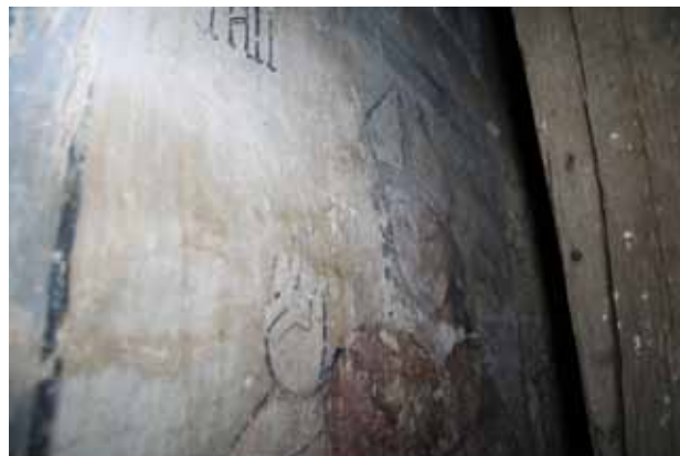
Igreja de São Martinho de Mouros. Parede do arco triunfal, do lado do Evangelho (atrás do altar colateral). São Brás.

Nesta Igreja conserva-se visível uma pintura mural figurando São Brás , como a legenda identifica – SAM BrAz –, atrás do retábulo que se encosta ao arco triunfal do lado do Evangelho (do lado esquerdo). Esta pintura era, provavelmente, parte de um programa mais vasto, atualmente impossível de ver e de avaliar, dado que o retábulo tapa a parede onde este se encontra (para ver esta pintura é necessário abrir a porta que se encontra do lado esquerdo do retábulo). Trata-se, com certeza, de uma pintura da primeira metade do século XVI.