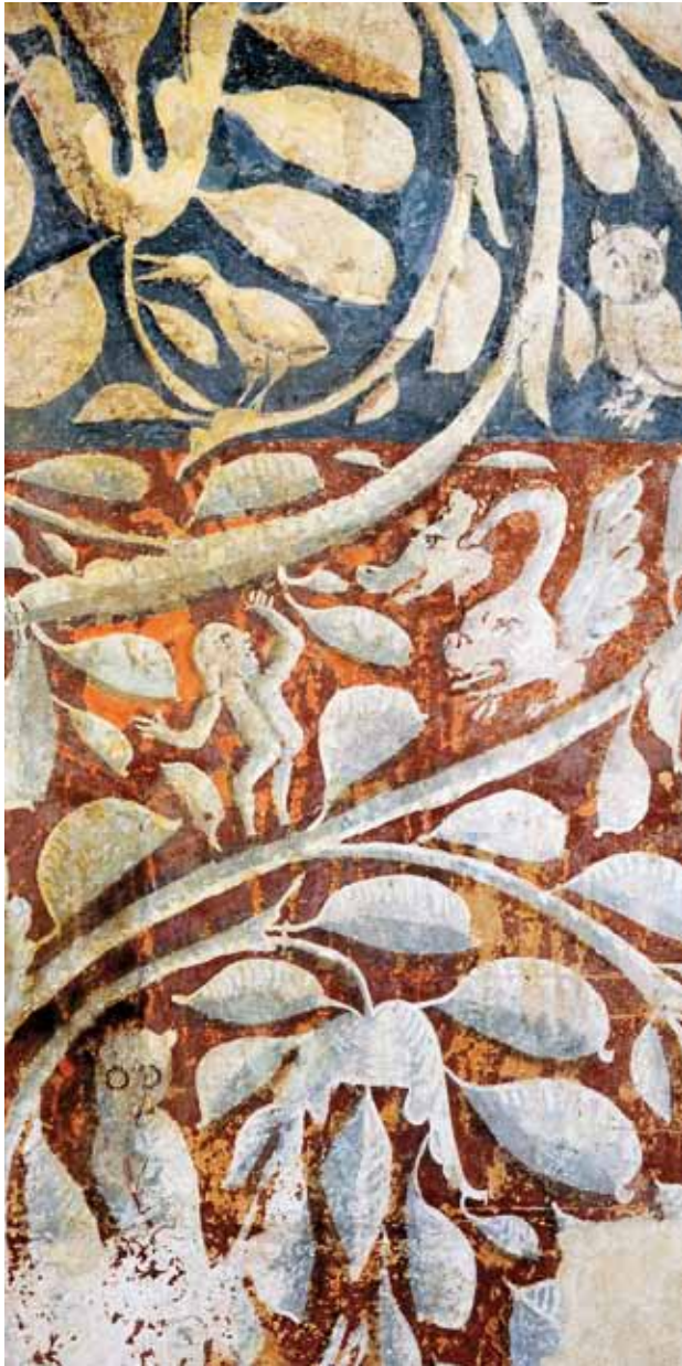
Igreja de São Martinho de Penacova. Parede fundeira da capela-mor. Painéis decorativos.