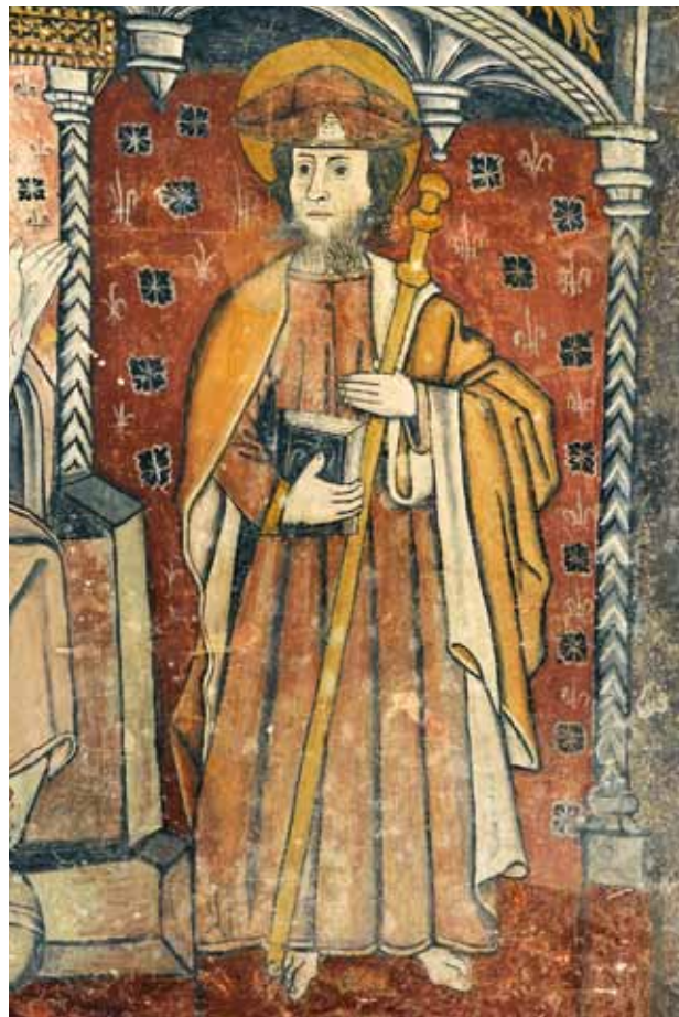
Igreja do Salvador de Tabuado. Parede fundeira da capela-mor do lado da Epístola. São Tiago .

Na representação de São Tiago , opta-se pelo São Tiago peregrino (e não pelo Mata Mouros , por exemplo) como, aliás, é mais comum no Norte de Portugal e nesta época.