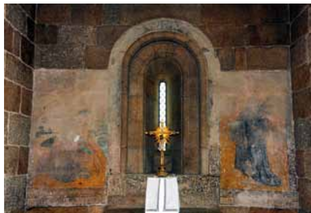
Igreja de São João Baptista de Gatão. Parede fundeira da capela-mor. Jesus a caminho do Calvário e Santo António .