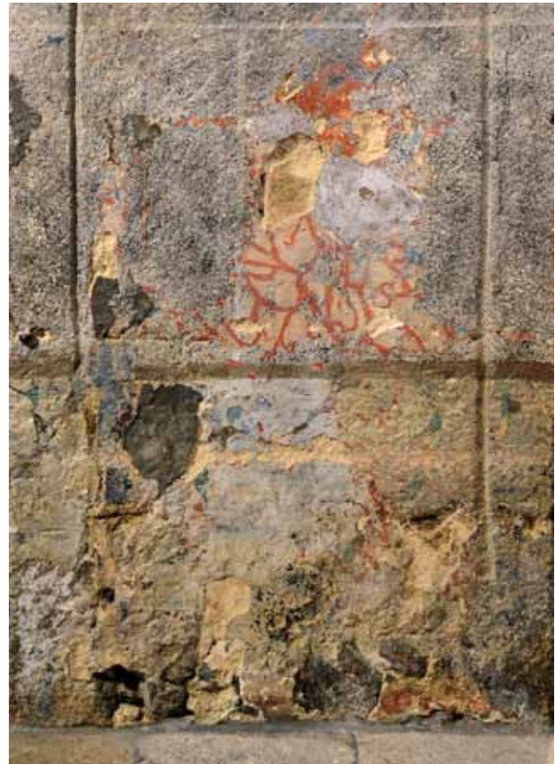
Igreja de Santa Maria Maior de Tarouquela. Jambas do arco triunfal.

Na Igreja de Santa Maria de Tarouquela conservam-se porções de rebocos pintados quer na capela-mor, quer no arco triunfal (conservam-se partes de pintura sobre reboco colorindo os relevos românicos) e suas jambas (talvez motivos vegetalistas, possivelmente do século XVI), quer na nave, quer na zona do óculo que se encontra no espaço que serve atualmente de sacristia. Para além disso, existem pequenos testemunhos da pintura mural de gosto