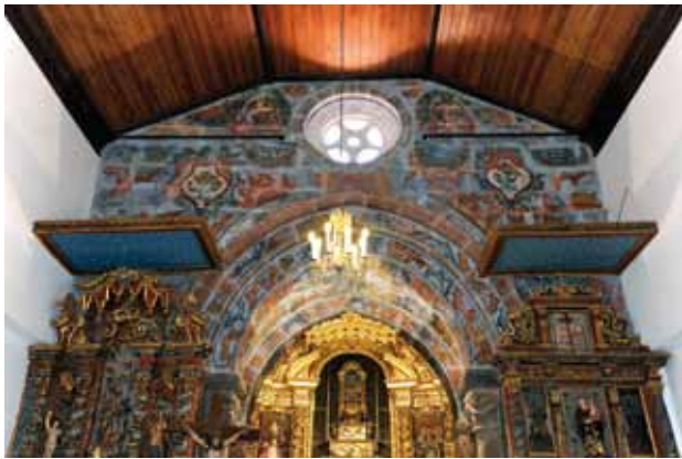
Igreja de São Pedro de Abragão. Parede do arco triunfal. Motivos rococó.

O programa de pintura mural para a parede do arco triunfal da Igreja de Abragão usa uma profusão de motivos decorativos de caráter rococó (gosto que se afirma entre nós depois do início do reinado de D. José I, em 1750), optando por vivas cores, entre as quais predominam os azuis e os rosas/vermelhos. Entrando na Igreja e olhando para esta pintura, quem se lembraria de que estava numa antiga, muitas vezes centenária, igreja românica? O objetivo deste programa, cuja composição não indica um mestre ou oficina eruditos, deve ter tido por desígnio, justamente, pôr à la mode uma construção de granito nu, de um românico tardio, mas que com tal pintura se transformava num espetacular rococó de formas robustas.