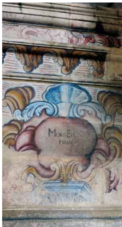
Mosteiro de Santa Maria de Vila Boa do Bispo. Capela do Santíssimo Sacramento (adossada à nave do lado sul). Jamba da pilastra esquerda do arco. Motivos joaninos e legenda "MORS EST VITAE".