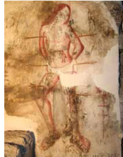
Capela de Santa Comba de Telões. Parede fundeira da capela-mor do lado da Epístola. São Sebastião .

mes, ou seja, sem nunca mencionarem os oragos dessas capelas anexas. Todavia, o facto de se ter conservado até hoje a designação de Santa Comba “de Telões” talvez testemunhe que esta capela era uma das anexas da igreja paroquial de Santo André.