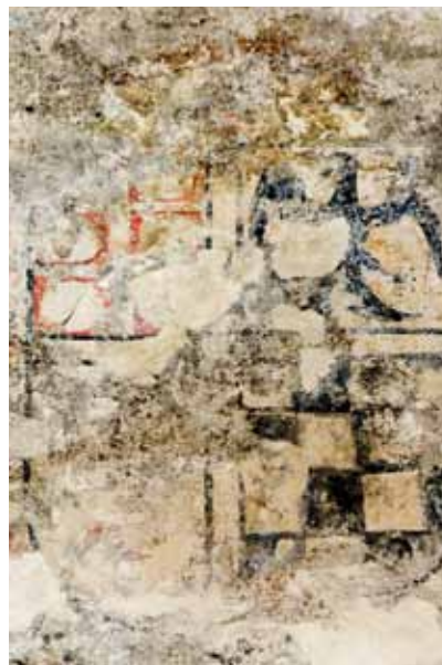
Igreja de São Mamede de Vila Verde. Centro da parede fundeira da capela-mor. Brasão.

O programa mais antigo foi encomendado pelo padroeiro desta Igreja, o abade comendatário do Mosteiro de Pombeiro, D. João de Melo (abade entre cerca de 1507 e 1525 7 ), de que é testemunho o seu brasão, que mandou pintar no topo das pinturas da parede fundeira da capela-mor.