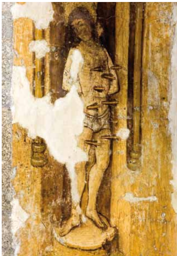
Mosteiro de São Pedro de Cête. Arcossólio na parede sul da nave. São Sebastião .

Nesta pintura não se figura propriamente São Sebastião, nem mesmo, como é vulgar, uma parte do seu martírio em que arqueiros lhe crivam o corpo de setas, mas sim uma imagem/escultura de São Sebastião sobre uma