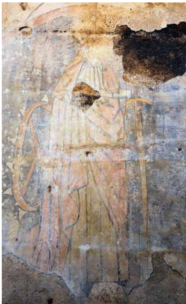
Igreja de São Tiago de Valadares. Parede fundeira da capela-mor do lado do Evangelho (atrás do retábulo-mor). Santa Catarina de Alexandria .

rísticas, é única. Tratava-se, certamente, de fazer o contraste entre o Inferno e os anjos e personagens sacras do restante programa, ou seja, de contrastar o Céu e o Inferno. Outra peculiaridade deste programa é o facto de o orago não se representar ao centro da parede fundeira, exigência que, provavelmente, só se explicitou nas Cons-