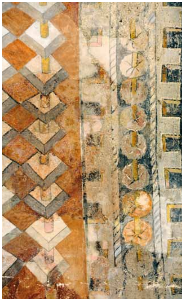
Igreja do Salvador de Tabuado. Parede fundeira da capela-mor. Barra com flores (?) atravessadas por fita entre barras finas de encordoado.

ra conservada, assim como nos extremos laterais correm molduras ao jeito de merlões e ameias (indicando-se de modo perspetivo o seu volume, como já referimos) e, entre elas, barra com flores (?) atravessadas por fita entre barras finas de encordoado.