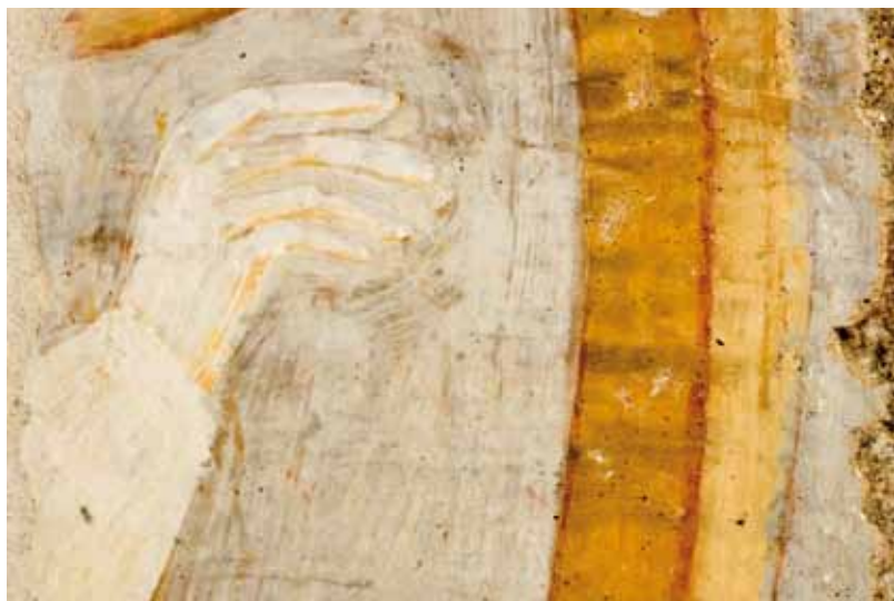
Ermida da Nossa Senhora do Vale. Detalhe de anjo a tocar harpa.