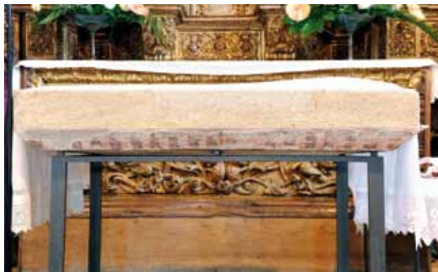
Igreja de Santa Maria de Meinedo. Mesa do altar-mor. Pintura decorativa.

Na atual mesa do altar-mor existe parte de um belo “friso” que, talvez, incluísse o motivo de paralelepípedos perspectivados e, no topo, losangos envolvendo uma flor de quatro pétalas, tudo ao gosto manuelino (gosto que se afirma no reinado de D. Manuel I (1495-1521) e que prosseguiu após a sua morte, ainda que já existisse desde o reinado de D. João II (1481-1495)).