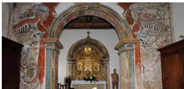
Mosteiro do Salvador de Travanca. Sacristia. Parede do arco triunfal. Pintura decorativa.

Já na parede que envolve este arco triunfal realizou-se um programa de pintura decorativa de gosto rococó (gosto que se afirma entre nós depois do início do reinado de D. José I, em 1750), com abundantes concheados volumosos, ao gosto das obras de André Soares, que tanta influência exerceu por todo o Minho. Esta pintura será, certamente, posterior a 1750.