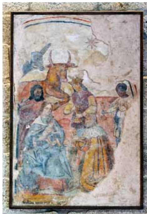
Mosteiro do Salvador de Freixo de Baixo. Parede sul da nave. Epifania ou Adoração dos Reis Magos .

A Epifania ou Adoração dos Reis Magos que parcialmente se conserva nesta Igreja, atualmente na parede sul da nave (do lado direito da Igreja), foi pintada por cima dessa primeira campanha. Nesta Epifania parece existir