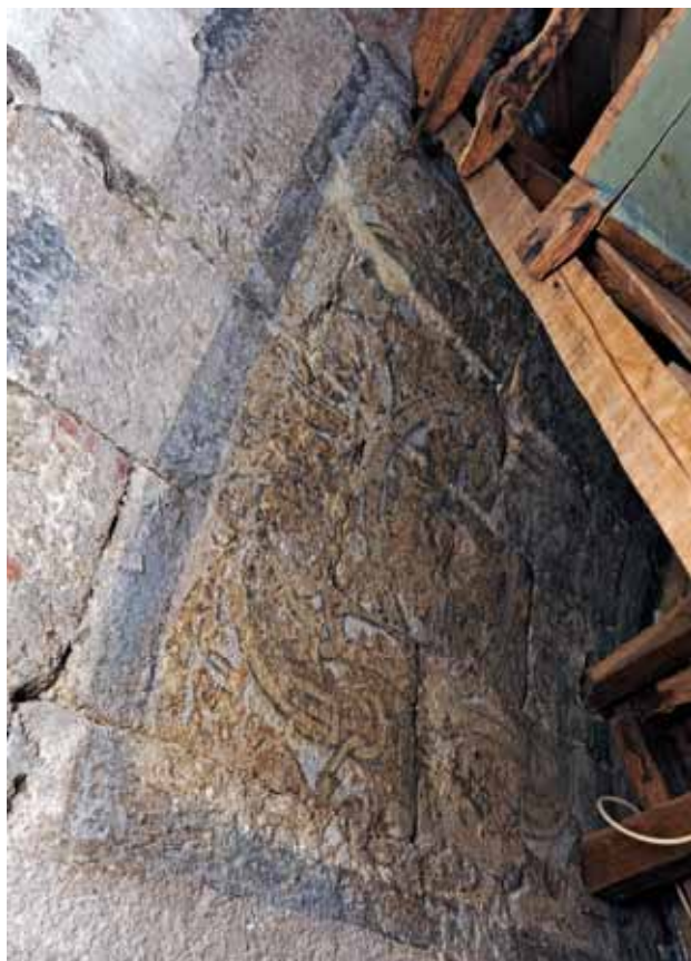
Igreja de São Pedro de Abragão. Capela-mor (atrás do retábulo-mor). Laçarias douradas sobre fundo branco.

Atrás do retábulo-mor (é preciso abrir as suas pequenas portas e passar para trás deste) conserva-se não só pintura sobre pedra nos frisos românicos, mas também um diferente e, provavelmente, anterior programa de pintura da abóbada com laçarias douradas sobre branco. Teremos que esperar pelo seu restauro para compreender verdadeiramente o seu programa geral (que, atualmente, parece ser de laçarias e incluir uma roda de navalhas) e a altura em que terá sido realizado (ainda no século XVI?, no século XVII?).