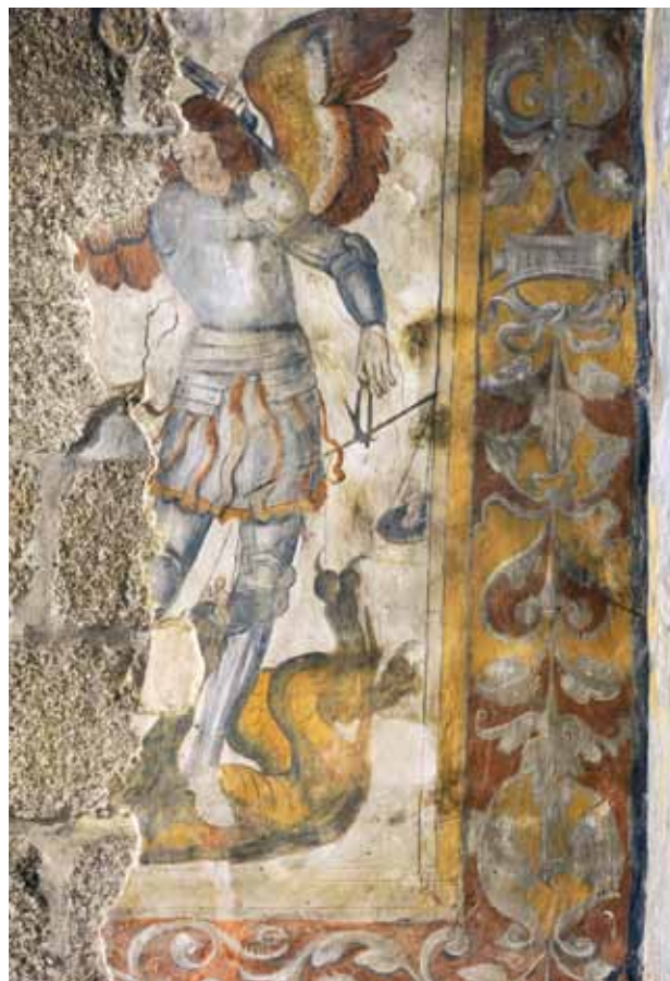
Igreja de Santo Isidoro de Canaveses. Parede fundeira da capela-mor do lado da Epístola. São Miguel Arcanjo e datação da pintura (1536).

capela-mor), ladeado por Nossa Senhora com o Menino e por Santa Catarina de Alexandria ; na parede do lado do Evangelho (do lado esquerdo da capela-mor) figura-se São Miguel Arcanjo pesando as almas e derrotando o dragão (“Travou-se, então, uma batalha no Céu: Miguel e os seus Anjos guerrearam contra o Dragão. O Dragão batalhou com os seus Anjos mas foi derrotado, e no Céu não houve mais lugar para eles. Esse Dragão é a antiga Serpente, é o chamado Diabo ou Satanás” (Ap 12, 7-9) e na parede do lado da Epístola (do lado direito da capela-mor), parte de um São Tiago . Ou seja, santos, certamente, da devoção do encomendador.