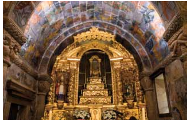
Igreja de São Pedro de Abragão. Paredes laterais da capela-mor. Motivos rococó.