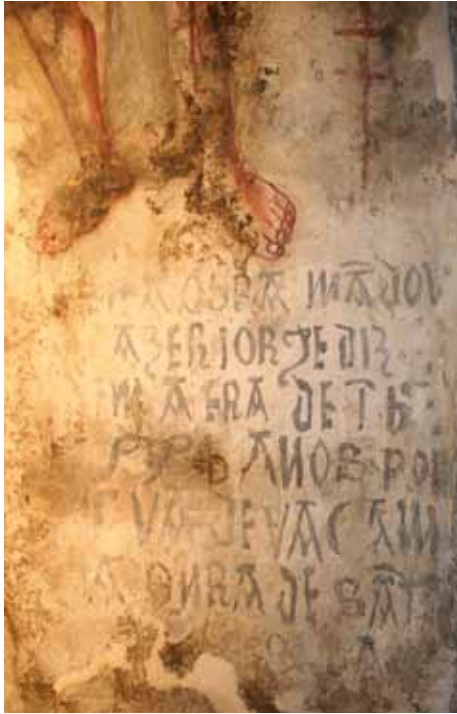
Capela de Santa Comba de Telões. Parede fundeira da capela-mor do lado da Epístola. Legenda.

para além de manifestar a sua devoção expressa a Santa Comba, encomendar um programa que, a cumprir-se o seu possível desejo de que esta capela ascendesse a igreja paroquial, fosse adequado a esse subido estatuto? A verdade é que assim veio a acontecer, ou seja, de capela curada passou a paróquia, como é testemunhado pelas Memórias Paroquiais de 1758 que nos informam que, nessa altura, era freguesia (paróquia) do bispado do Porto e anexa a "(...) São João de Ouvil. (...) Tem somente trinta fogos e tem de sacramento noventa e seis pessoas, e dez menores, e abzentes vinte e hum. (...) Hé do termo do concelho de Baião, tem hum só lugar que chama Te-loins que consta de trinta vezinhos. (...) A Igreja está no meio do lugar e não tem mais lugares que este. (...) O parocho ao presente hé vigário 6 , porém sempre foi curato