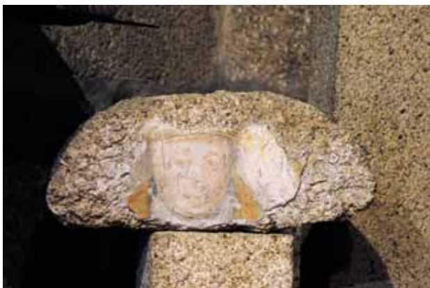
Igreja de Santo Isidoro de Canaveses. Fragmento de pedra exposto na capela-mor com pintura do rosto de Santo Isidoro .

O que se pintou, certamente por decisão do encomendador, nesta capela-mor de Santo Isidoro de Canaveses? Na parede fundeira encontrava-se, ao centro, a figuração do orago, Santo Isidoro (do qual se conserva o rosto, separado da restante pintura quando se desentapou a fresta, e cujo fragmento de pedra está atualmente exposto na