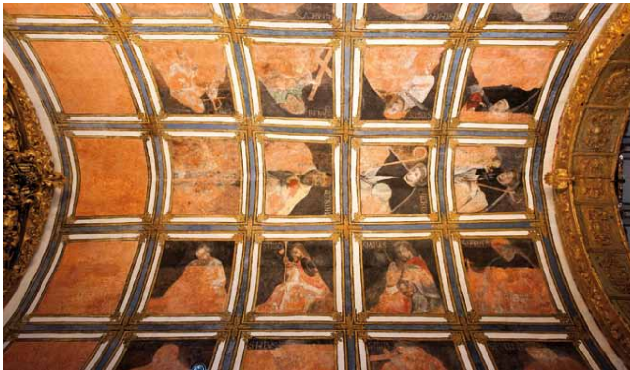
Mosteiro de Santa Maria de Vila Boa do Bispo. Abóbada da capela-mor. Representação de santos.

monstratense Hermann Joseph de Steinfeld, que viveu entre 1152 e 1240 e se tornou famoso pela sua castidade e culto a São José e à Virgem ; a sua festa celebra-se a 7 de abril; a ordem dos premonstratenses era, tal como os crúzios, formada por cónegos regrantes), talvez São Patrício , considerado cónego regrante e evangelizador da Irlanda e grande difusor desta forma de vida religiosa (aqui legendado como S. PIPCIO), talvez, também, São Brandão da Irlanda (legendado como SA D o B/RAD o ) e São Pos[s]idónio (provavelmente, “aportuguesamento” de S. Possidius, o santo biógrafo de Santo Agostinho de Hipona; aqui legendado como S. POSDON/I o ).