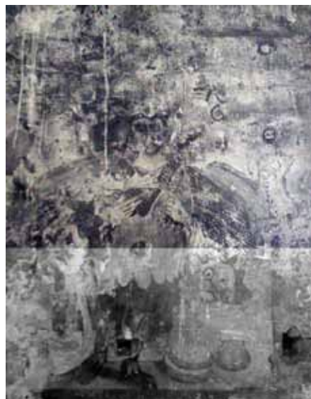
Igreja de São Mamede de Vila Verde. Capela-mor. São Mamede.