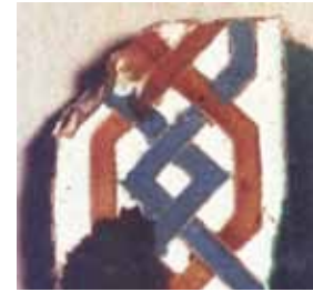
Igreja de São Martinho de Penacova. Parede fundeira da capela-mor. Barras verticais com motivos de laçaria (esquerda). Azulejo com motivos de laçaria em corda-seca (Museu Nacional do Azulejo) (direita)

A representação do santo aparece ambientada por colunas e arco conopial abatido, de gosto manuelino (como acontecia com a Nossa Senhora com o Menino de Bravães, no concelho de Ponte da Barca, pintada pela mesma oficina); o plano de fundo apresenta silhuetas de árvores e pássaros de perfil (também semelhantes aos das pinturas de Bravães, de 1501 (Caetano, 2001: 34)), barras decorativas com folhagem e pequenos animais ou evocando cenas de caça (presentes na capela-mor de Vila Marim, no concelho de Vila Real (Caetano, 2001: 34)), tal como em alguma iluminura das primeiras décadas do século XVI. É de salientar que o enquadramento do brasão, quer em Penacova, quer em Vila Verde, é também evidenciador de grande precocidade no gosto e na execução, uma vez que os seres híbridos segurando uma coroa de louros estão documentados, na iluminura portuguesa, na base do enquadramento do frontispício do Livro IV de Além Douro , de Álvaro Pires (1513), ou noutros casos mais tardios ainda, ou, no caso da decoração escultórica, no friso da capela do cruzeiro do Convento de Tomar (1535) (Bessa, 2007: 201). Ora, estas pinturas, sendo da encomenda de D. João de Melo, só poderão datar do período em que era abade do Mosteiro de Pombeiro e, portanto, detentor do padroado desta Igreja, ou seja, entre cerca de 1507 e 1526.