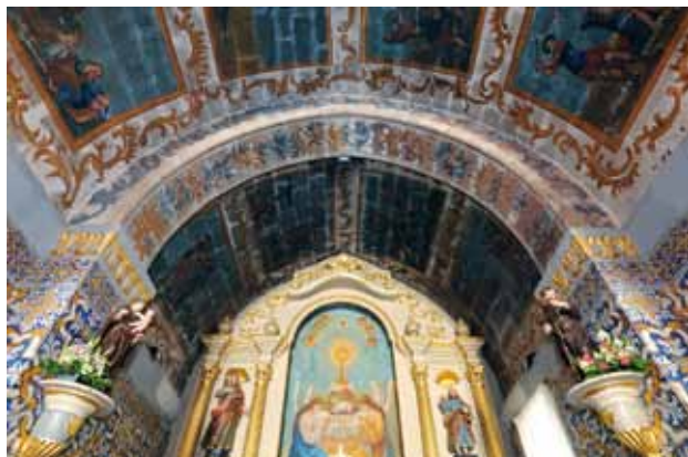
Igreja de Santo André de Vila Boa de Quires. Arco triunfal e barras de enquadramento dos painéis na abóbada da capela-mor. Motivos rococó.

do início do reinado de D. José I, em 1750), assim como nas barras de enquadramento dos painéis na abóbada da capela-mor. Estes painéis são dedicados ao ciclo da