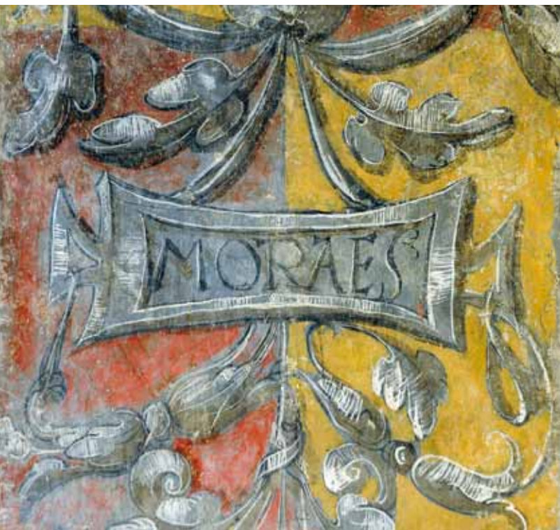
Igreja de Santo Isidoro de Canaveses. Parede fundeira da capela-mor do lado da Epístola. Assinatura do mestre (Moraes).