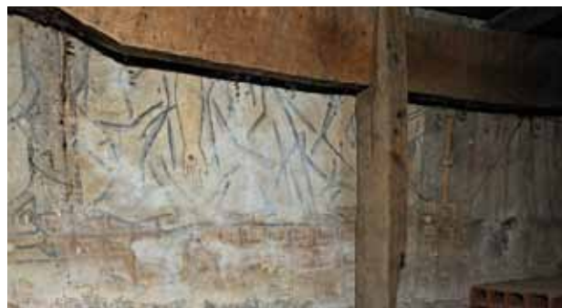
Igreja de São Tiago de Valadares. Centro da parede fundeira da capela-mor (atrás do retábulo-mor). Pietà .