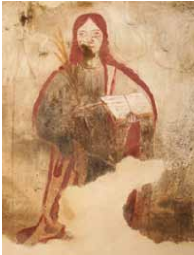
Capela de Santa Comba de Telões. Centro da parede fundeira da capela-mor. Santa Comba .