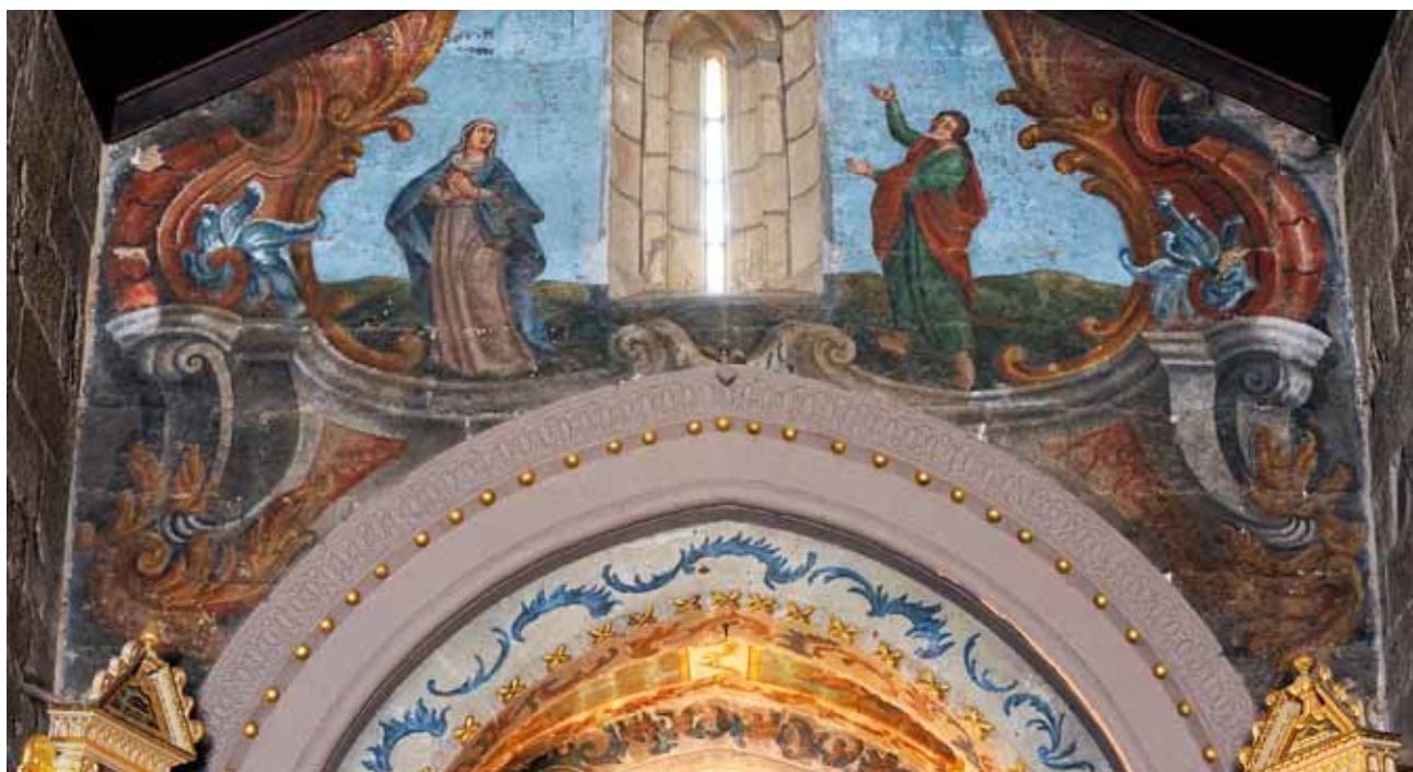
Igreja de Santo André de Vila Boa de Quires. Parede do arco triunfal. Calvário do qual restam as figuras de Nossa Senhora e de São João Evangelista .

Nas jambas e no arco triunfal propriamente dito há motivos rococó (gosto que se afirma entre nós depois