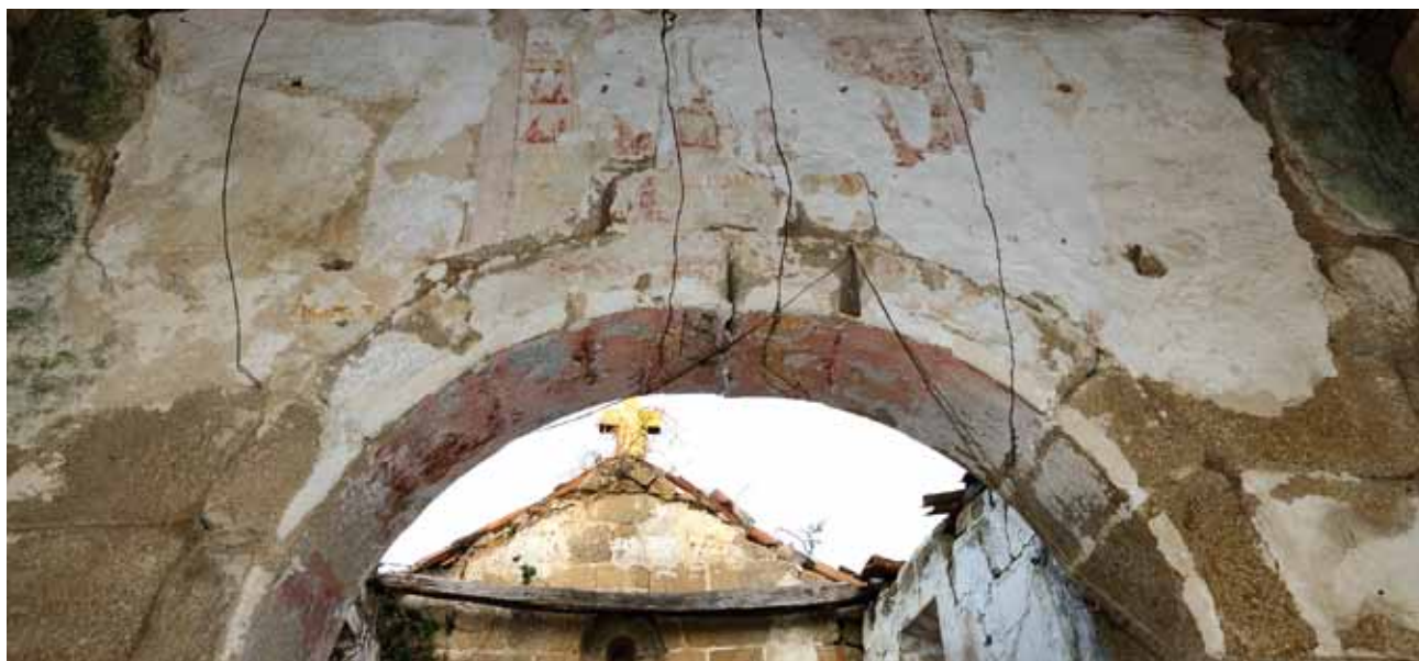
Igreja de São Pedro da Ermida. Arco triunfal. Pintura mural visível debaixo das caiações.

porções de pintura mural que julgamos serem do século XVI. Teremos que esperar pelo restauro desta Igreja para saber o que se esconde debaixo das extensas caiações que ainda subsistem.