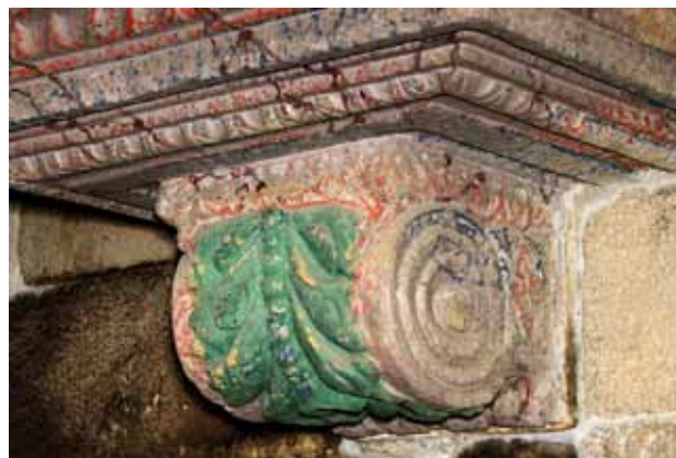
Igreja de Santa Maria Maior de Tarouquela. Base do púlpito.

Ainda neste concelho é possível identificar outros vestígios de pintura mural a fresco, nomeadamente em São Pedro da Ermida, situada na freguesia de Oliveira do Douro. Este edifício encontra-se em ruínas, estando a capela-mor destelhada. No arco triunfal são visíveis pequenas