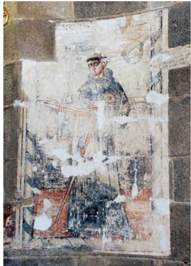
Mosteiro de Santa Maria de Pombeiro. Absidiolo do lado da Epístola. São Mauro (esquerda) e São Plácido (direita).