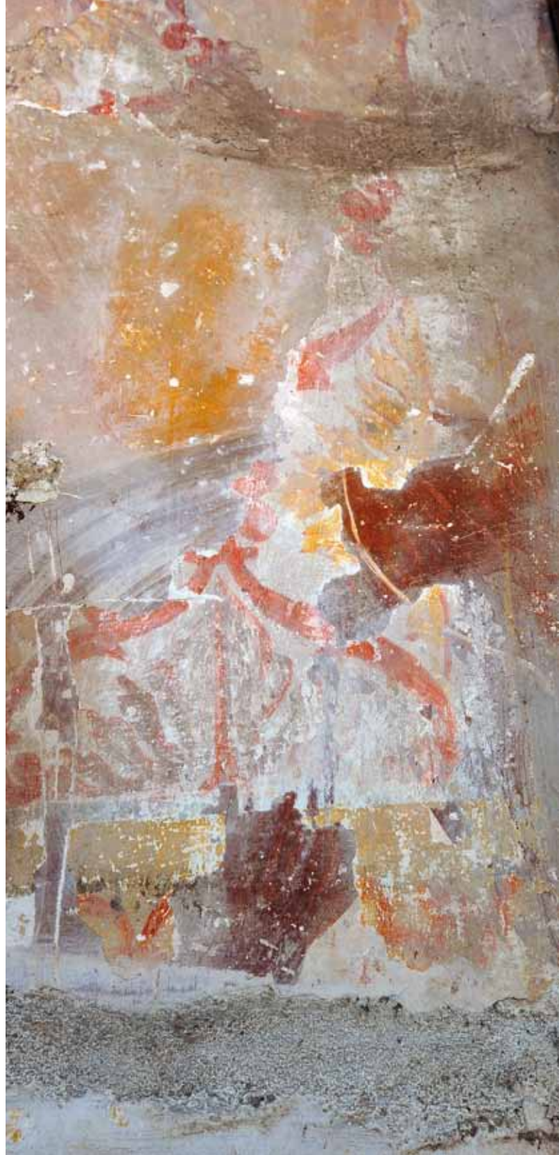
Igreja de Santa Maria de Meinedo. Parede fundeira da capela-mor do lado da Epístola (atrás do retábulo-mor). Pintura decorativa.