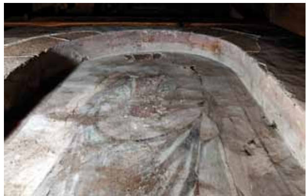
Igreja de Santa Maria de Meinedo. Centro da parede fundeira da capela-mor (atrás do retábulo-mor). Santa Maria .