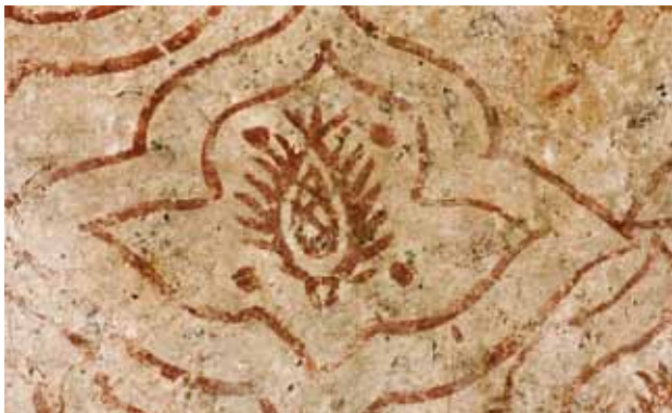
Igreja de São Mamede de Vila Verde. Paredes laterais da nave. Quadrifólios .

Esta oficina trabalhou também na nave, onde deixou as paredes decoradas com um motivo muito presente nas suas obras, os quadrifólios .