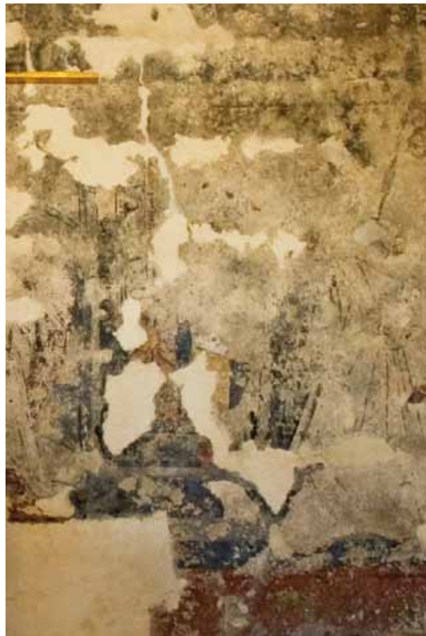
Igreja de São Mamede de Vila Verde. Parede fundeira da capela-mor do lado da Epístola. São Bernardo .

de de Vila Verde, nessa parede pintou-se São Mamede ladeado por São Bento (fundador da Ordem beneditina) e por São Bernardo (que muito contribuiu para o desenvolvimento da Ordem de Cister, que se criou com a vontade de proceder a uma reforma beneditina, para viver com maior rigor a Regra de São Bento) e, no topo, para acompanhar as duas águas do telhado, fingiu-se um frontão