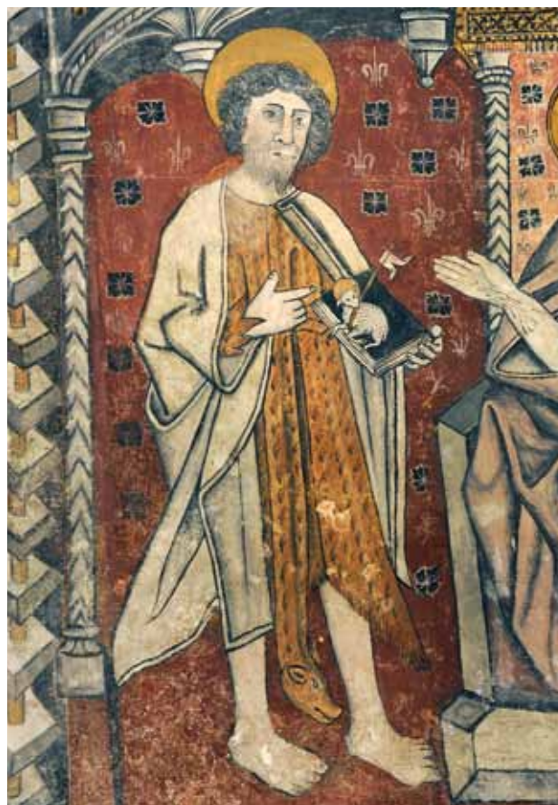
Igreja do Salvador de Tabuado. Parede fundeira da capela-mor do lado do Evangelho. São João Baptista .

Foi prestada atenção à caracterização do São João Baptista e, para além do seu atributo, o cordeiro (“Vendo Jesus que passava, apontou: “Eis o Cordeiro de Deus””. (Jo 1, 36)), cuidou-se a caracterização das suas vestes, com a pele de camelo com que é descrito nos Evangelhos segundo São Mateus e segundo São Marcos.