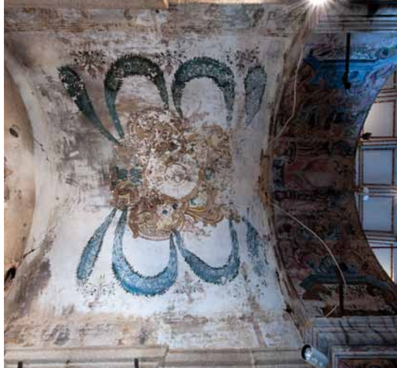
Mosteiro de Santa Maria de Vila Boa do Bispo. Capela do Santíssimo Sacramento (adossada à nave do lado sul). Intradorso do arco e abóbada. Motivos joaninos (arco) e possível alusão ao Espírito Santo (abóbada).

A pouca distância deste Mosteiro, em Alpendorada, é possível identificar outros vestígios de pintura mural, designadamente na abóbada da bela capela-mor da Igreja do Mosteiro de São João Baptista. Teremos que esperar pelo restauro desta obra para, com segurança, identificar a sua verdadeira temática. O que podemos ver neste momento parece indicar que a composição tem anjos adolescentes segurando molduras de enquadramento; a mais exterior destas molduras parece incluir concheados de gosto rococó (gosto que se afirma entre nós depois do início do reinado de D. José I em 1750) e a mais interior é formada por grinalda de folhas e frutos, motivo tão característico do gosto joanino (c. 1725-1750). Assim, como esta pintura parece manifestar, tanto quanto é possível avaliar atualmente, um gosto de transição do joanino para o rococó, talvez seja algo posterior a 1750. O sentido da figuração central só poderá ser seguramente identificado depois do restauro, mas são visíveis monges beneditinos, o que parece indicar um programa dedicado à exaltação de santos desta ordem.