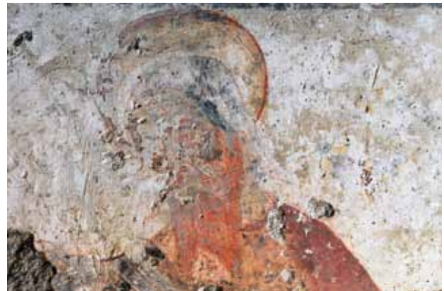
Igreja de São Vicente de Sousa. Capela-mor (atrás do retábulo-mor). Figuração da cabeça de um santo.

Existem pequenas porções de pintura mural na capela-mor, atrás do retábulo-mor (é preciso abrir as suas pequenas portas e passar para trás deste), que indicam que aqui houve uma campanha no século XVI. O que resta é muito pouco, mas inclui uma pequena parte de uma figuração sacra. Na verdade, é possível que os silhares onde se encontra a pintura tenham sido mudados de posição, um deles invertido, aí se figurando a cabeça de um santo com o seu nimbo.