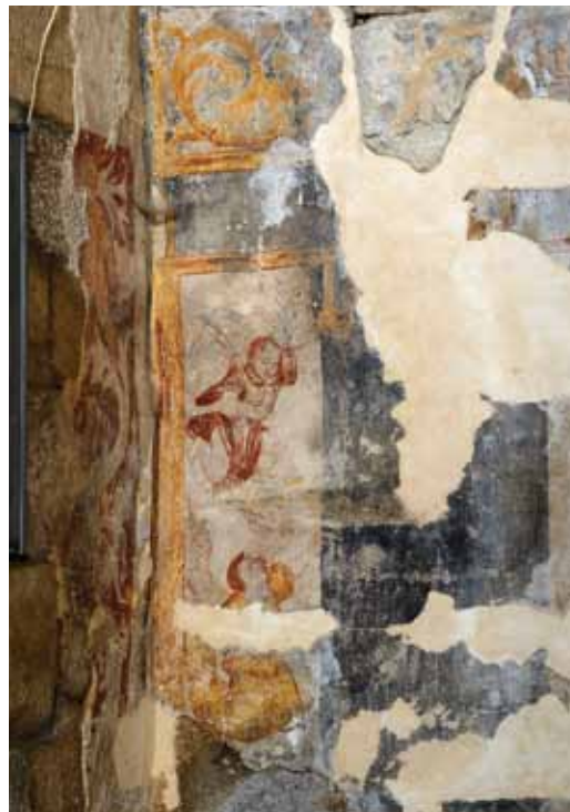
Mosteiro de Santa Maria de Cárquere. Parede do arco triunfal do lado do Evangelho (atrás do altar colateral). Faixa de cor azul ladeada por barra com anjos esvoaçantes.

As pinturas murais que subsistem nesta Igreja encontram-se atrás dos altares de fora (altares colaterais). Do lado do Evangelho (do lado esquerdo) apenas se preserva uma faixa de cor azul (para servir de fundo a imagem do santo patrono do altar?), ladeada por uma barra com anjos esvoaçantes e, do lado da Epístola (do lado direito), figuraram-se Santo António e Santa Luzia . Em ambos os casos, estas pinturas figurativas eram acompanhadas, nas paredes laterais da nave, por pintura de carácter decorativo com motivos de rinceaux (folhagens enroladas).