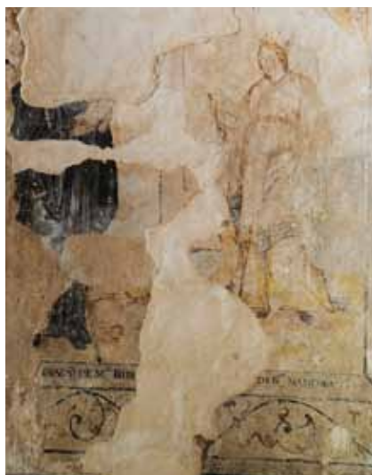
Igreja de São Nicolau de Canaveses. Parede lateral sul da nave. Abade beneditino e Santa Catarina de Alexandria .

Na parede sul da nave (do lado direito da Igreja) conservam-se também várias pinturas murais de épocas diferentes. Num dos programas figura-se um Abade beneditino e Santa Catarina de Alexandria . Esta intervenção parece ter-se desenvolvido desde o nível do pavimento (rodapé) até um nível bastante alto da parede. Estes santos parecem ter sido