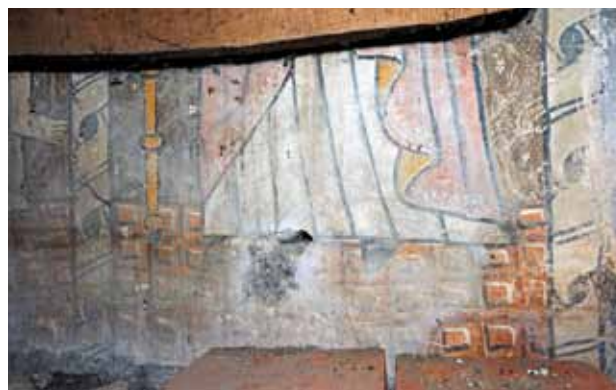
Igreja de São Tiago de Valadares. Centro da parede fundeira da capela-mor (atrás do retábulo-mor). Santo com bordão.

tituições Sinodais de D. Diogo de Sousa para o bispado do Porto (1496), que devem ser posteriores à realização destas pinturas murais.