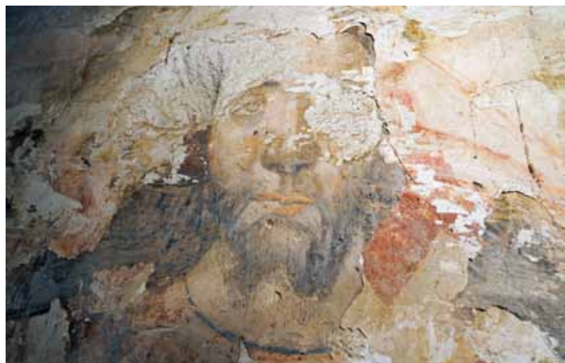
Igreja do Salvador de Ribas. Centro da parede fundeira da capela-mor (atrás do retábulo-mor). O Salvador.