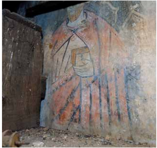
Igreja de São Tiago de Valadares. Capela-mor. Parede do lado da Epístola (atrás do retábulo-mor). São Paulo .