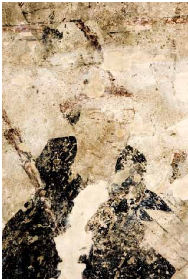
Igreja de São Mamede de Vila Verde. Parede fundeira da capela-mor do lado do Evangelho. São Bento .