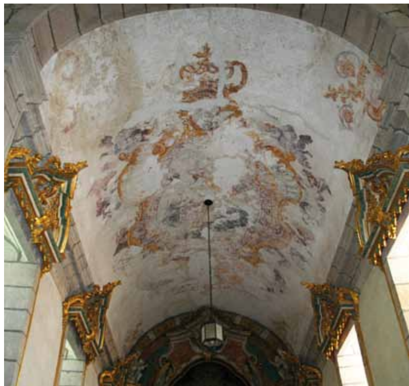
Igreja de São João Baptista de Alpendorada. Abóbada da capela-mor.