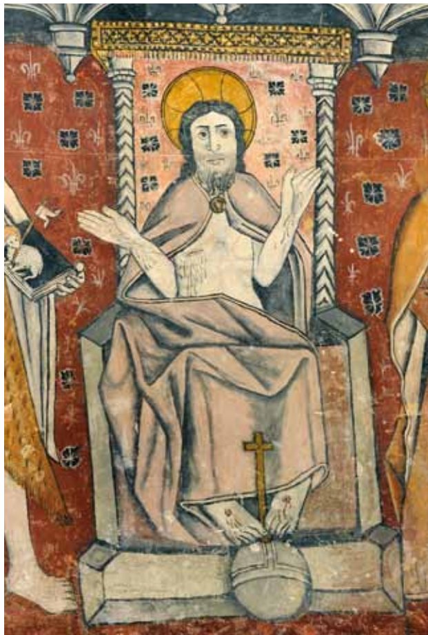
Igreja do Salvador de Tabuado. Centro da parede fundeira da capela-mor. O Salvador .

Na figuração do orago, o Salvador , Cristo é representado sentado num trono, exibindo as chagas da Paixão, tendo o orbe a seus pés, ou seja, como o Ressuscitado e Juiz – e Salvador – do fim dos tempos, no Julgamento Final.