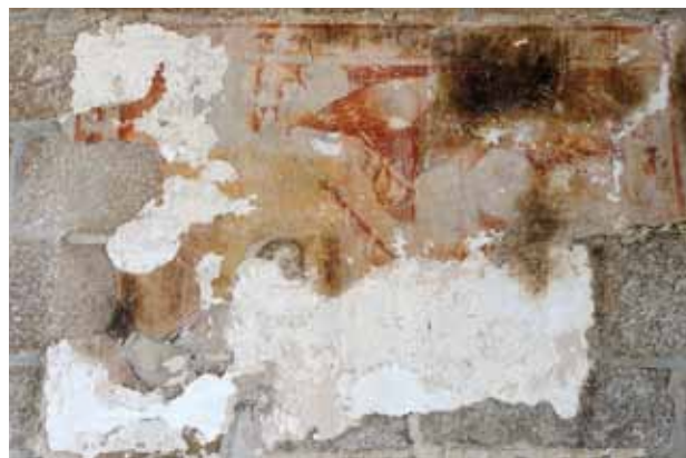
Igreja de São Nicolau de Canaveses. Parede lateral sul da nave. Anunciação .

Ainda nesta parede, mais perto do portal principal, encontra-se outro fragmento de pintura. Talvez se tratasse de uma Anunciação (anjo com bastão e filacteria nele enrolada, pomba/Espírito Santo sobre a Virgem (?) e, ao seu lado esquerdo, livro aberto). No tratamento de figura, parece tratar-se de desenho e modelação estimando a rotundidade das formas, movimento e expressividade, até mesmo manifestando uma certa terribilitá ; a barra de enquadramento deste programa tem recorte retilíneo com folhas de acanto enroladas. Mais uma vez, apenas podemos colocar uma hipótese de cronologia, atendendo ao tipo de barra de enquadramento: serão estas pinturas do século XVIII, de acordo com o gosto da talha de “estilo nacional” (c. 1690-1725)?