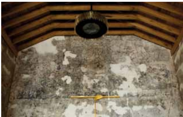
Igreja de São Mamede de Vila Verde. Parede fundeira da capela-mor. Dois seres híbridos seguram o brasão (topo). São Mamede ladeado por São Bento e São Bernardo (abaixo).

triangular que, entre motivos de folhagens, inclui dois seres híbridos que seguram o brasão do encomendador, D. João de Melo. Estas pinturas foram realizadas pela oficina