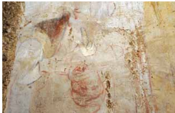
Igreja do Salvador de Lufrei. Parede fundeira da capela-mor do lado da Epístola (atrás do retábulo-mor). Figuração de um santo.

(do lado direito da capela-mor), para além dos mesmos motivos florais sobre fundo amarelo já referidos, existe uma figuração de um santo cuja mão é representada em gesto de abençoar.