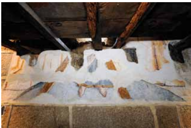
Igreja de Santo André de Telões. Parede fundeira da capela-mor (atrás do retábulo-mor). Santo André .

de grinalda. O que se conserva revela bom desenho e interesse pela modelação, que eficazmente se consegue com o desenho e com o claro-escuro. Trata-se de uma pintura atribuível à oficina que realizou as pinturas de 1501 em São Salvador de Bravães, no concelho de Ponte da Barca (barras com enrolamentos e quadrifólios de