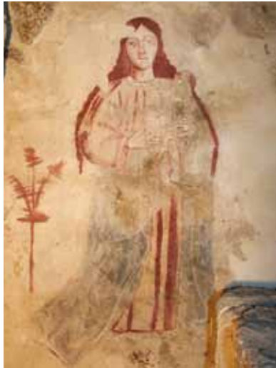
Capela de Santa Comba de Telões. Parede fundeira da capela-mor do lado do Evangelho. Nossa Senhora com o Menino .