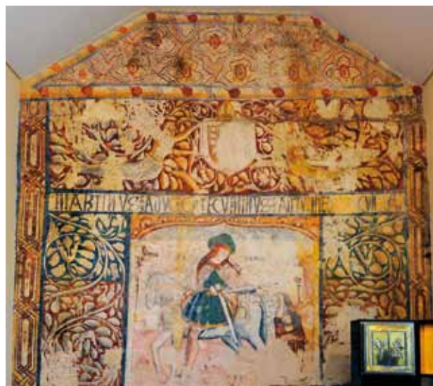
Igreja de São Martinho de Penacova. Parede fundeira da capela-mor. São Martinho .

O que se pintou na parede fundeira da capela-mor constituiu-se como um magno programa, que procura soluções para a articulação da figuração do santo padroeiro com a parede em que se ia colocar. Assim, concebeu-se um projeto que incluía um rodapé de azulejos fingidos, seguindo o moti-