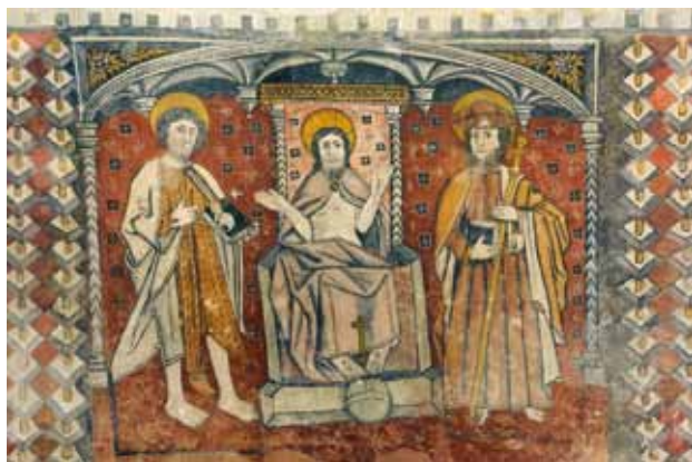
Igreja do Salvador de Tabuado. Parede fundeira da capela-mor. O Salvador ladeado por São João Baptista e São Tiago com moldura ao jeito de merlões e ameias .

A figuração central do programa, São João Baptista , o Salvador e São Tiago , é ladeada por motivos decorativos que não encontramos noutras pinturas.