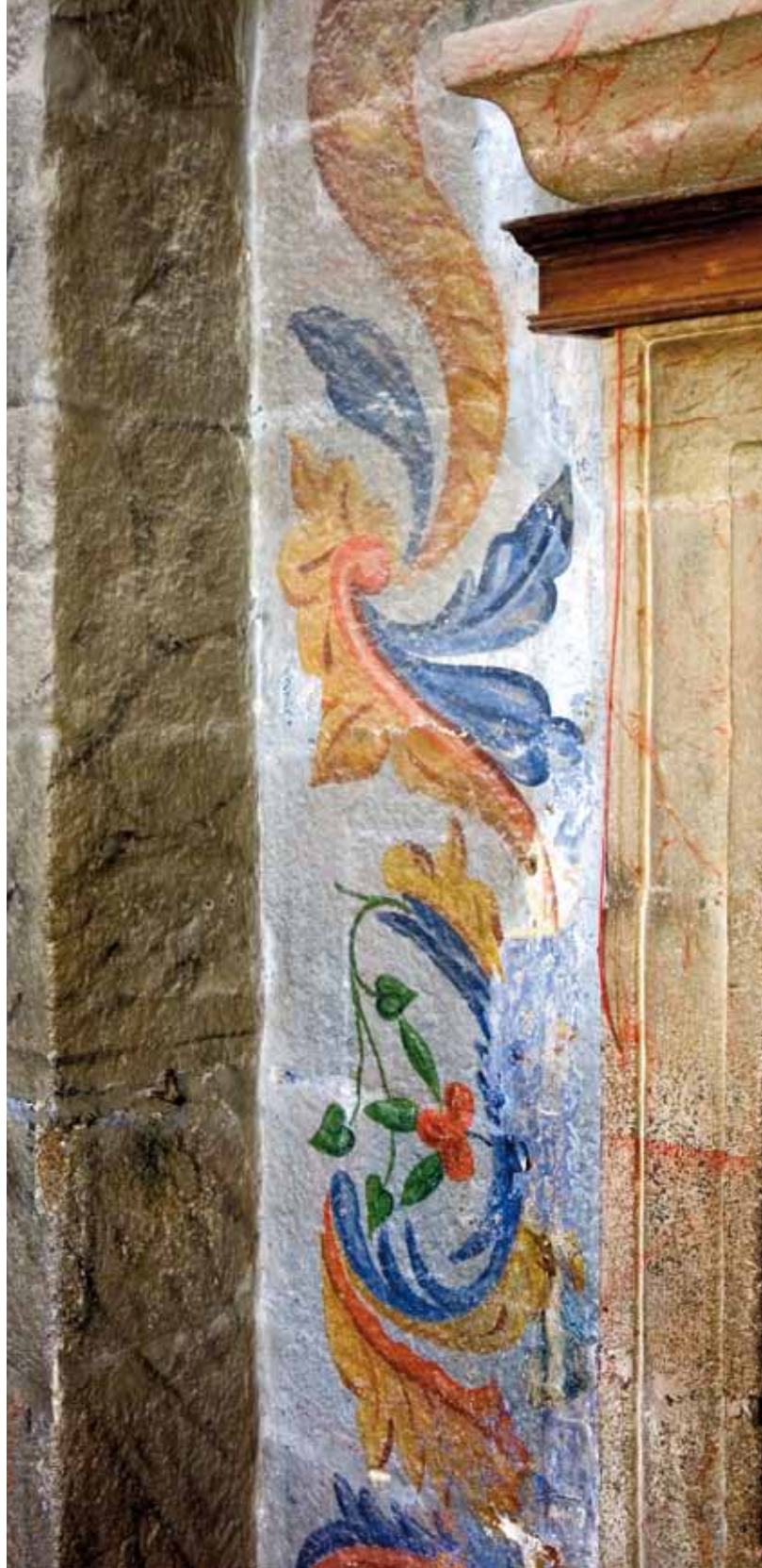
Igreja de São Pedro de Abragão. Paredes laterais da capela-mor. Motivos rococó.