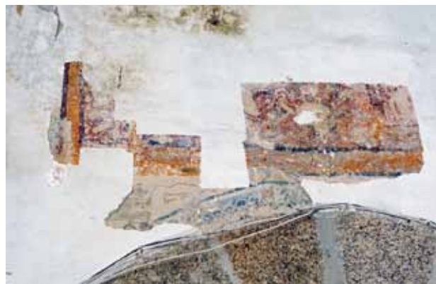
Igreja do Salvador de Lufrei. Topo do arco triunfal. Crucifixão.

No topo do arco triunfal, o que é atualmente visível indica que, como era regra para este local, aqui haveria uma Crucifixão (o crucifixo deverá ter desaparecido, uma vez que a fresta foi desentaipada) acompanhada por Nossa Senhora e São João Evangelista (sobre o topo do arco