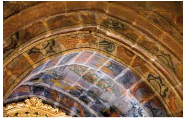
Igreja de São Pedro de Abragão. Arco triunfal e abóbada da capela-mor. Conjunção de motivos rococó e joaninos.

como conchas e cornucópias, das quais saem grinaldas de flores com concheados ao modo do rococó. Esta associação de motivos decorativos joaninos e rococó talvez indique que esta pintura seja de um período de transição, algo posterior a 1750, e que talvez seja anterior à pintura da parede do arco triunfal. Já nas paredes laterais da capela-mor a pintura opta sistematicamente por motivos de inspiração rococó.