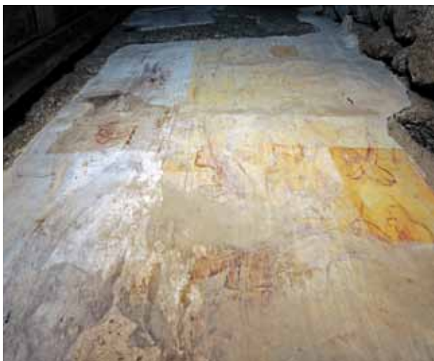
Igreja do Salvador de Lufrei. Parede fundeira da capela-mor (atrás do retábulo-mor). Motivos florais e ramagens sobre fundo amarelo.

Existe pintura mural na capela-mor, que julgamos ser do século XVI, e que é visível atrás do retábulo-mor (é preciso abrir as suas pequenas portas e passar para trás deste). Os rebocos foram cortados na zona central da parede fundeira onde a caixa da tribuna do retábulo-mor de talha se encosta. Neste momento, podemos ver, na parede fundeira, enquadramentos com motivos florais e ramagens sobre um fundo amarelo e, do lado da Epístola