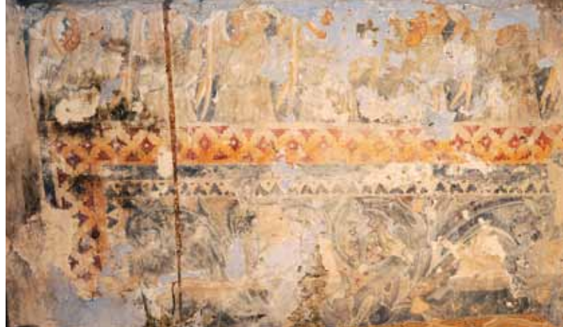
Igreja do Salvador de Ribas. Rodapé da parede fundeira da capela-mor (atrás do retábulo-mor). Ramagem enquadrada por molduras (em baixo) e meios corpos de anjos (em cima).

Igreja do Salvador de Ribas. Parede fundeira da capela-mor do lado do Evangelho (atrás do retábulo-mor). Santa recostada numa almofada.