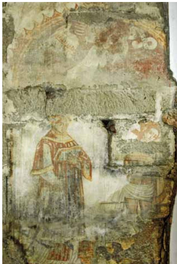
Igreja de Santa Maria de Idães. Parede do arco triunfal do lado do Evangelho. Parte da figuração de uma Anunciação (em cima), Santo Clérigo e São Sebastião (em baixo).

que conservam parcialmente um belo programa de pintura mural do século XVI. Este programa 5 , com as alterações de altura e de gosto do próprio arco triunfal e da parede que o envolve, não subsistiu inteiramente, mas conserva-se, no seu topo, o anjo Gabriel anunciando a