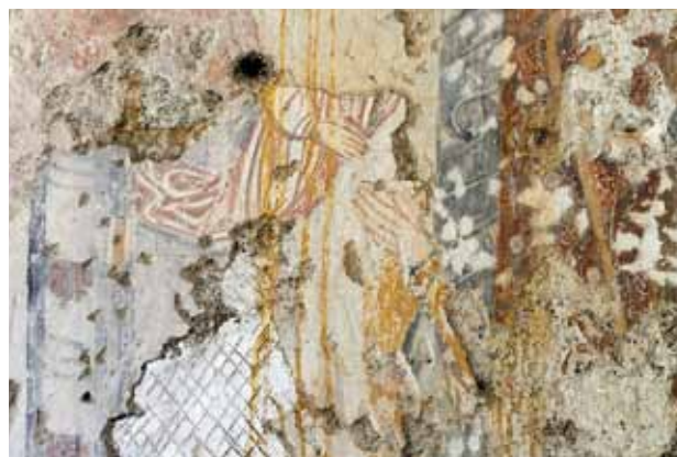
Igreja de São Nicolau de Canaveses. Parede lateral norte da nave. Fragmentos de pintura com anjo voando e figura ajoelhada de mãos postas em gesto de oração.

Junto ao Santo Antão conservam-se fragmentos de pintura com um anjo voando e uma figura ajoelhada de mãos postas em gesto de oração, que, no estado em que se encontram, não permitem propor nenhuma identifica-