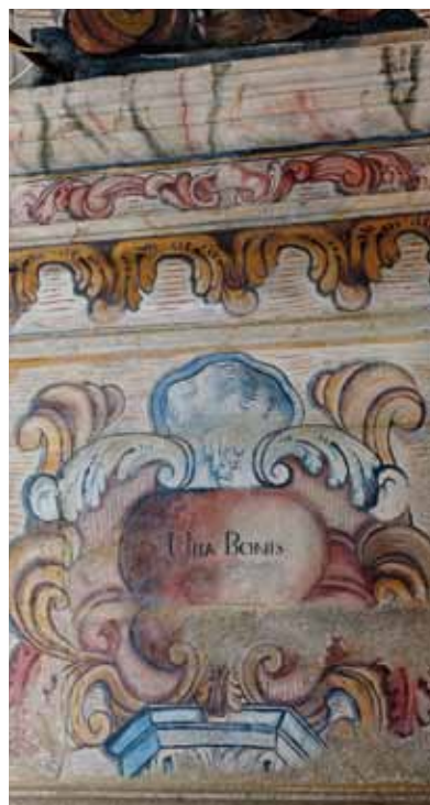
Mosteiro de Santa Maria de Vila Boa do Bispo. Capela do Santíssimo Sacramento (adossada à nave do lado sul). Jamba da pilastra direita do arco. Motivos joaninos e legenda "VITA BONIS".