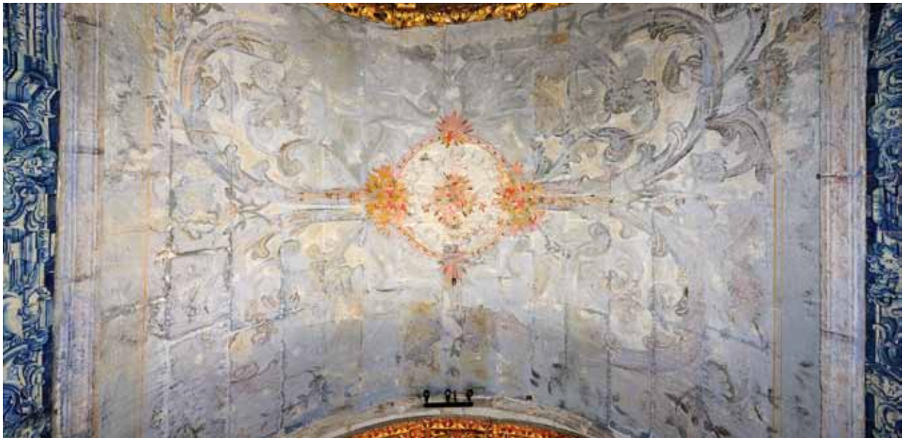
Igreja de São Martinho de Soalhães. Abóbada da Capela de São Miguel.