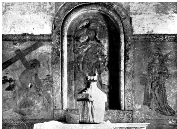
Igreja de São João Baptista de Gatão. Parede fundeira da capela-mor. São João Baptista (DIREÇÃO-GERAL DOS EDIFÍCIOS E MONUMENTOS NACIONAIS – Frescos. Monumentos: Boletim da Direção-Geral dos Edifícios e Monumentos Nacionais. Lisboa: MOPC-DGEMN. N.º 10 (Dez. 1937), fig. 43).

poder ter dois benefícios ou até três, compatíveis: abade de Santa Eulália de Gondinços (atualmente no concelho de Vila Verde), recebendo em 1529 nova bula apostólica, dada pelo papa Clemente VII, provendo-o na Igreja de Santa Eulália da Cumieira (atualmente no concelho de Santa Marta de Penaguião) e, finalmente, “(...) No dito dia [27 de janeiro de 1532] sendo vagaa a parrochial igreja de saam Joam de gatam da terra de Sousa deste arcebispado por morte natural de martinho do couto abade que foy della sua senhorya confirmou (...) Licenciado bacharel manuell falcaão (...)” (Bessa, 2007: 184-189). Ou seja, se as pinturas da capela-mor tiverem sido realizadas nos anos 20 de Quinhentos, como acreditamos que foram, o seu provável encomendador foi ou Tristão Pinto ou Martinho do Couto.