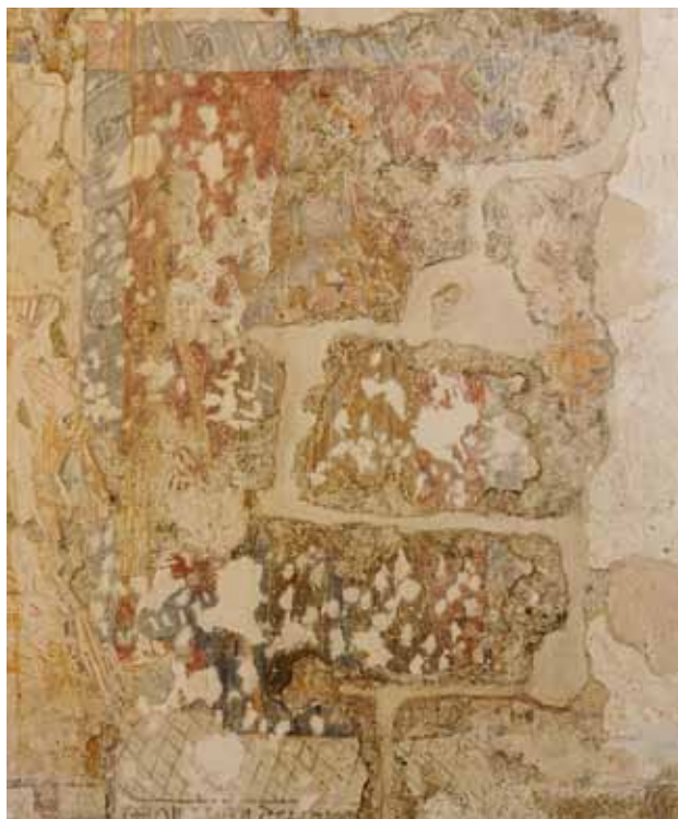
Igreja de São Nicolau de Canaveses. Parede lateral norte da nave. Santo Antão .

Por exemplo, na parede norte da nave (do lado esquerdo da Igreja) encontramos a mais antiga pintura identificável nesta Igreja, um painel figurando Santo Antão , pintando-se atrás do santo um motivo recorrente